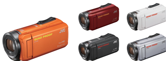
Colori: Nero/Bianco/Arancione/Rosso (GZ-R315) Argento (GZ-R310)