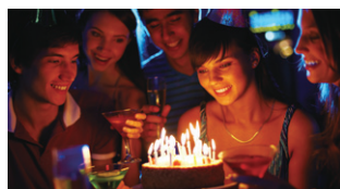
Con Super LoLux