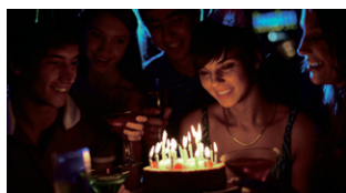
Senza Super LoLux

Il sensore d'immagine CMOS retroilluminato da 2,5M permette di rendere più luminose le scene in interni e notturne.